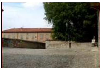
6. Piazza Quarto Stato