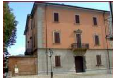
3. Palazzo Malaspina