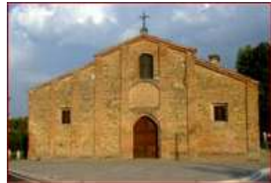
9. Pieve di San Pietro (sec. x – xv)