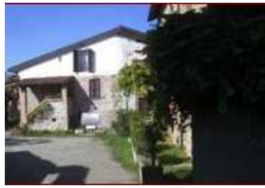
2. Casa Pellizza