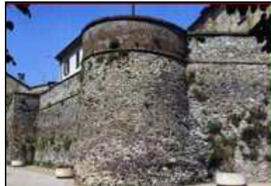
7. Castrum medievale (sec. x)