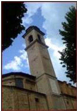
5. Chiesa di San Pietro